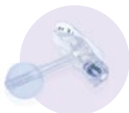
● Passender Ersatzbutton