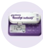
Flocare® Infinity™ Ernährungspumpe