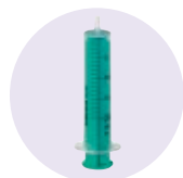
● Luer-Spritze 10 ml