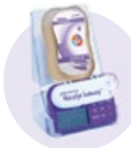
Infusions- oder Tischständer