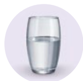
● Steriles oder destilliertes Wasser zum Blocken des Ballons